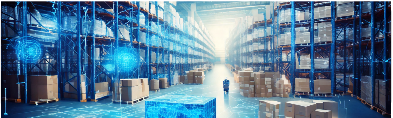
Smart Warehouse System